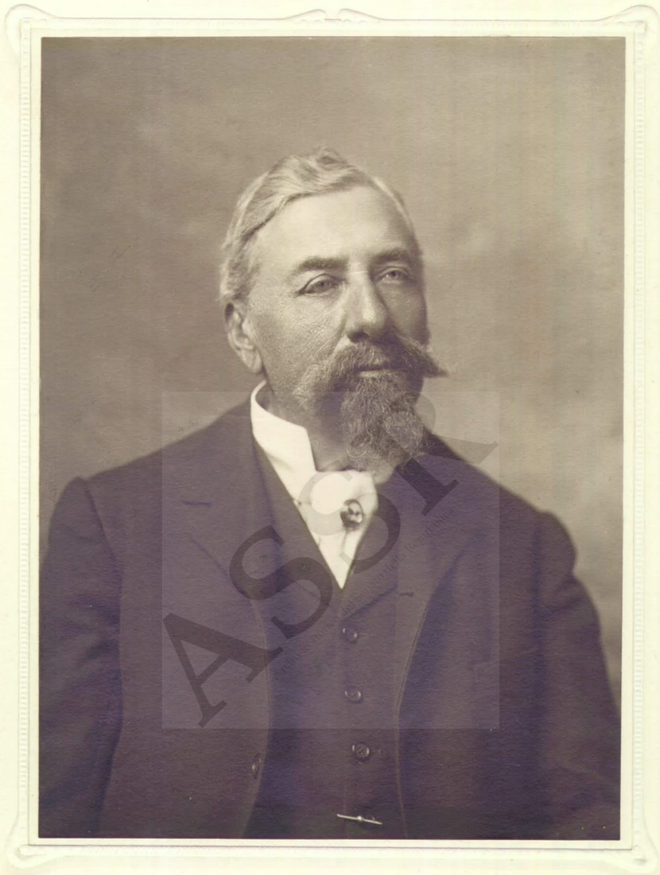
Senatore E. Ginistrelli